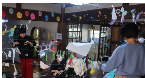
重度重複障害児との美術の取組み (LEO×ドゥイ,2024)