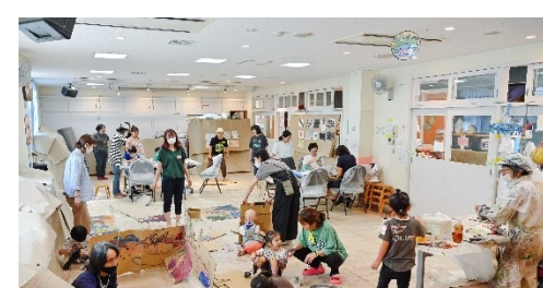
知的障害児・者との美術の取組み (さらん×Art Lab Ova, 2024)